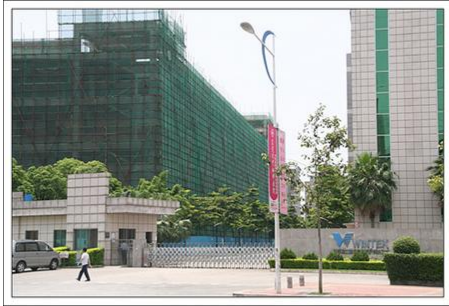
圖片正門右為萬士達工廠，左為正在興建的新廠。